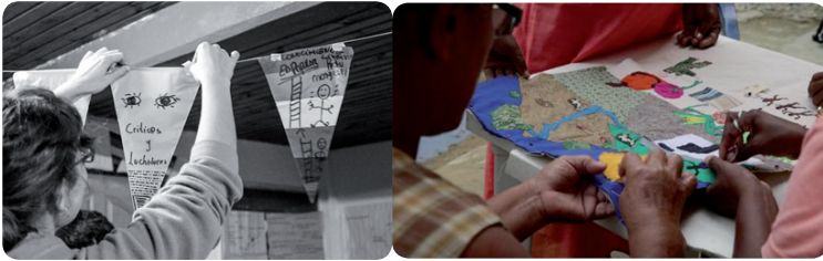
Imagen 3. 15 Oct 2020 Imagen 4. Mujeres tejedoras de Mampujan. Noviembre de 2021.

Con ello, entramos en una lógica entre aquello que se expresa como el acontecimiento relacional creativo como praxis: una relación social que narra de Sí (como grupos, colectivos o comunidades) un acontecer de reuniones, encuentros e intercambios que conjuga visiones y sentidos de realidad como actores–agentes ante las situaciones sociales o políticas de vulneración que les impacta, situaciones de vulneración a la que se ven sometidos. Así, ante la situación de tensión que llega a marca la vulneración el lazo creativo entrama el auto–reconocimiento (empoderamiento en lo personal, singular y colectivo).