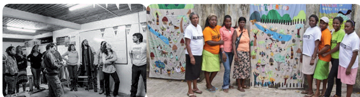
Imagen 1. Construcción plural de saberes otro sello del Bachi. 2020. Imagen 2. Mujeres tejedoras de Mampujan. Bolívar – Colombia.

caso del Bachillerato Popular Furilofche, se expresan como acción educativa alternativa desde zonas urbano–marginal en Bariloche (Argentina) redes personales significativas en jóvenes y adultos. Por otro lado, el caso del colectivo de mujeres tejedoras “Mujeres Tejiendo Sueños y Sabores de Paz”, una iniciativa de reconstrucción de memoria histórica, como forma de movilización social comunitaria que actuará en el marco de la exigibilidad de los derechos y visibilización de lo sucedido en el conflicto armado en Colombia.